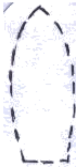
หูกระต่าย