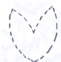
หัวกระต่าย